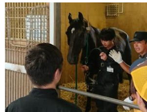
馬のハトドリガ実習