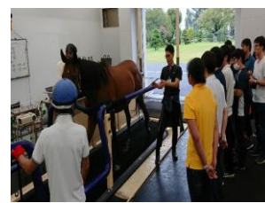
トレットミルを用いた歩法観察